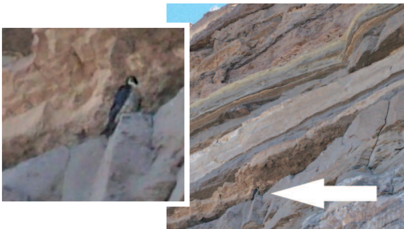
Foto 7. Nido 1. La flecha blanca señala a una hembra adulta en esta amplia repisa. A la izquierda, imagen superpuesta y ampliada del ejemplar.