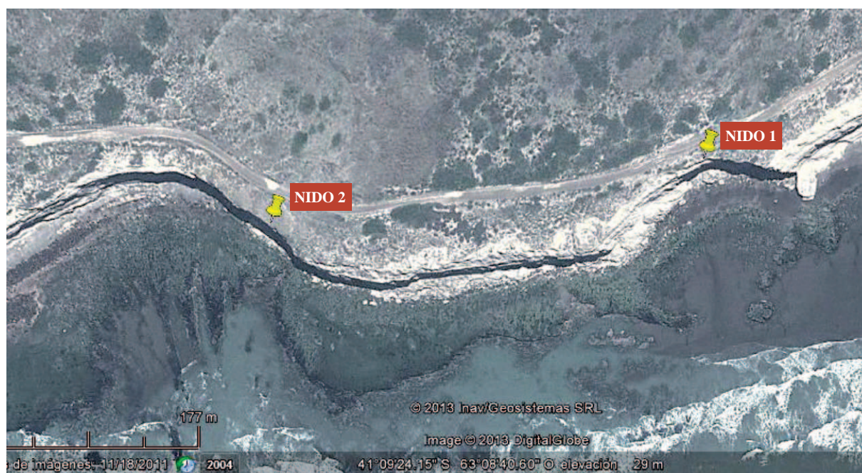
Mapa 1. Ubicación de los nidos 1 y 2 en el Área Natural Protegida Punta Bermeja. La separación entre estos nidos era de tan solo 322 metros (en línea recta).

Por la tarde, se observó el nido desde la parte superior del acantilado. Faltando unos 400 metros para llegar al sitio, una pareja de halcones comenzó a sobrevolarlo. La hembra, identificable por su mayor tamaño, inició una serie de vuelos rasantes mientras vocalizaba con una intensidad tal (análoga a la observada cuando ubicado en la parte superior de un acantilado a la altura