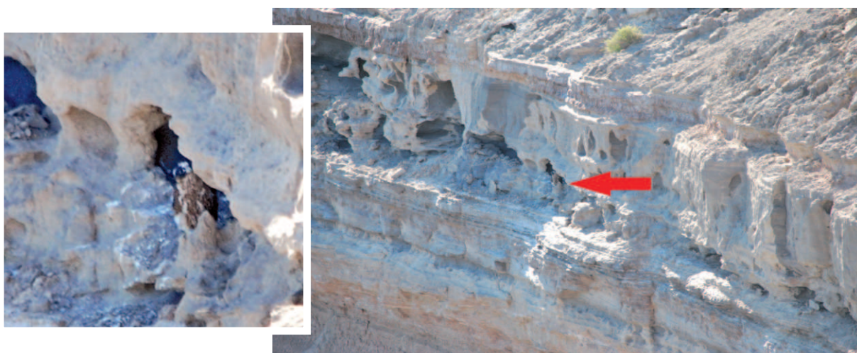
Foto 5. Nido 2 el 4 de diciembre de 2012. La flecha roja indica su posición y la de un pichón de Falco peregrinus en la entrada del mismo. A la izquierda, imagen superpuesta y ampliada del nido y del pichón Foto: Eduardo De Lucca.

playa, al Nido 1, en donde una hembra (de coloración más clara, sin las tonalidades rojizas observables en la hembra del Nido 2) ocupaba el nido (Foto 7). Recién en cercanías a la base del paredón, este ejemplar se alejó. Pasados unos minutos, un adulto transfirió un ave, en pleno vuelo, a uno de los pollos, presa que fue inmediatamente transportada a la repisa de nidificación (Foto 8). La distancia entre los Nidos 1 y 2 fue de unos 322 metros.