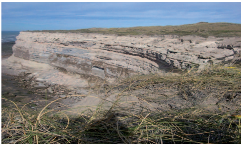
Foto 4. Vista del paredón de nidificación de la pareja del Nido 2.