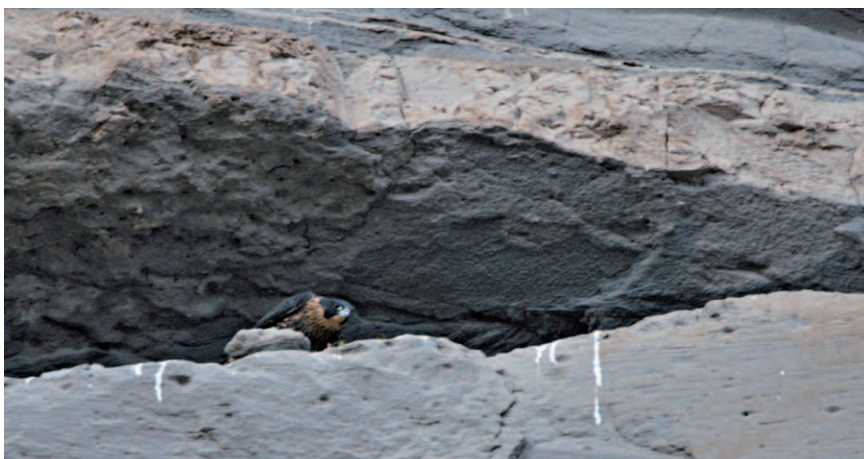
Foto 8. Ejemplar juvenil en Nido 1 el 4 de diciembre de 2012, en pleno período de crianza fuera del nido, con una presa recién aportada por uno de sus progenitores.