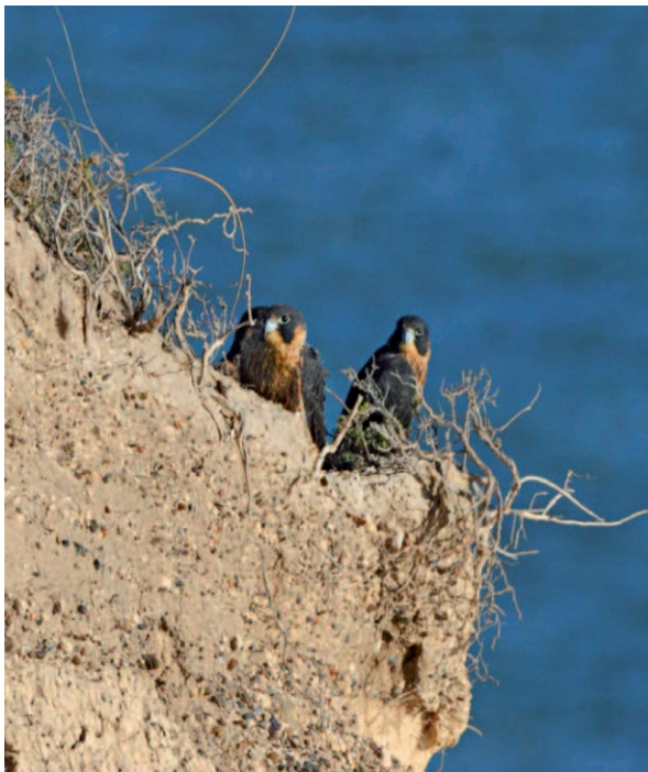
Foto 2. Dos de los tres pollos del Nido 1, el 22 de noviembre de 2012, al inicio del período de crianza fuera del nido.