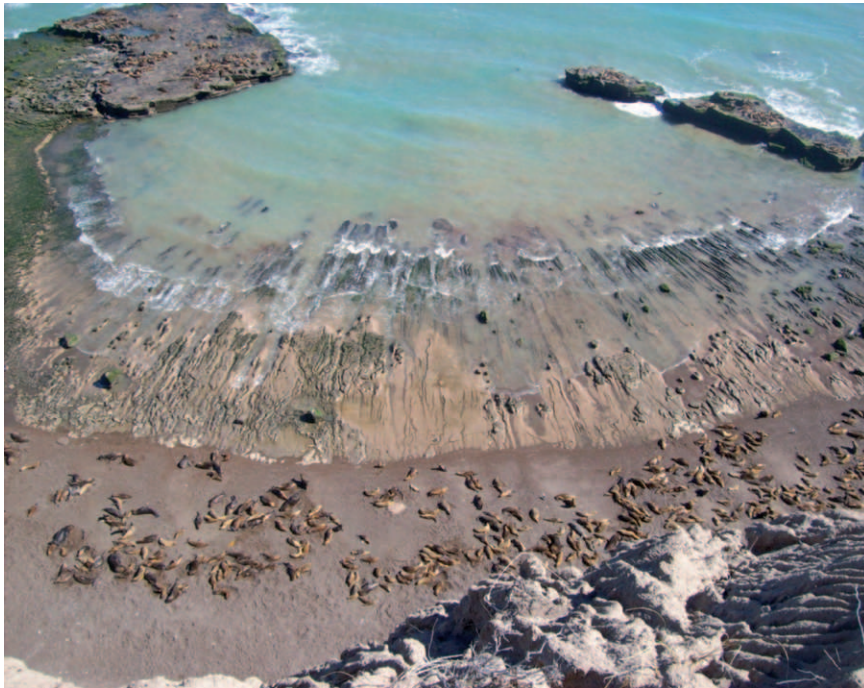
Foto 6. Vista desde la parte superior del acantilado justo sobre el Nido 2. Bahía conocida como “La Herradura”. Nótese la presencia de numerosos ejemplares de Otaria flavescens .

2012) así como la inclusión de esta rapaz, indicadora de la salud de los ecosistemas y uno de los emblemas de la conservación de la naturaleza del siglo XX, en el plan de manejo de esta reserva.