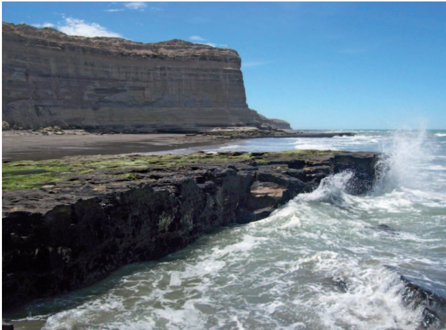
Foto 1. Características de los acantilados en el Área Natural Protegida Punta Bermeja. Desde hace al menos unos 22 años, sitio de nidificación para Falco peregrinus cassini .

El 4 de diciembre se realizó un acercamiento por la